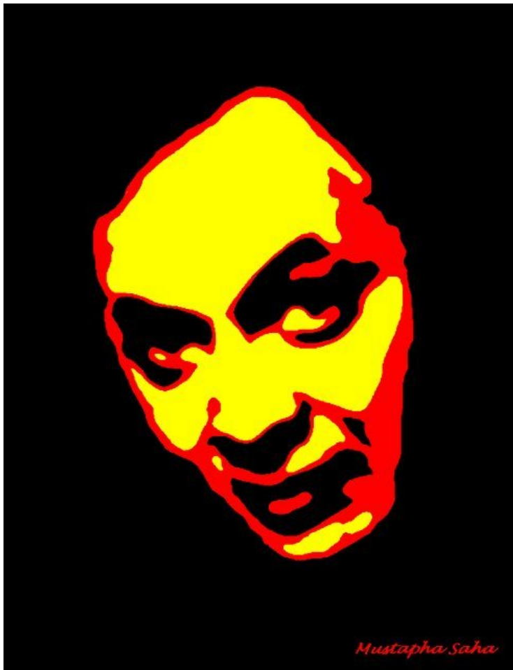
Portrait d'Ahmed Cherkaoui par Mustapha Saha. Peinture sur toile, 100 x 81 cm.

Le jeune artiste acquiert les règles classiques de la plastique occidentale, les titres de noblesse universitaire, la reconnaissance des galeries internationales. Il se détourne ex abrupto des chemins balisés, des écoles labellisées, des gratifications caramélisées. Sa terre natale regorge d'indices indécryptables, de permanences indatables, de rémanences transmutables. L'ambitieuse recherche s'attaque d'emblée à l'inconnaissable du connaissable, l'invisible du visible, l'indiscernable du perceptible. Se prospecte l'interaction secrète entre techniques magiques et magie de l'art. Le travail en profondeur sur surfaces réduites traque les fissures, les invisibilités tangentes, les échappatoires indétectables. Les tentatives de pénétration des références héréditaires, cuirassées dans leur récursivité close, glissent aussitôt dans l'imprévisible. Les formes extensibles se recombinaient avec malice. Le jeu des miroirs démultiplie les points de fuite. L'amplification de l'infinitésimal bute sur l'inexprimable. Les brèches à peine suggérées se cimentent. L'intelligibilité se fragmente. La stylistique se façonne dans l'hybridation symbolique.