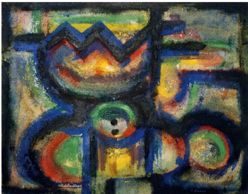
"Le Couronnement", Ahmed Cherkaoui (1934 - 1967), 1964. Huile sur toile, 91 x 119 cm. Achat en 1964, dépôt du Centre national des arts plastiques en 2013 au Centre Pompidou, Paris.